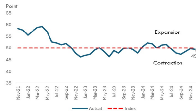
Figure 1. S&P PMI Manufacturing