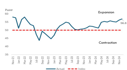
Figure 2. S&P PMI Services