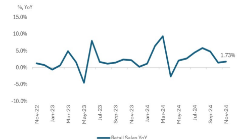
Figure 4. Retail Sales (YoY)