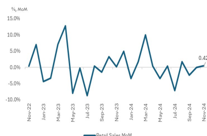
Figure 3. Retail Sales (MoM)